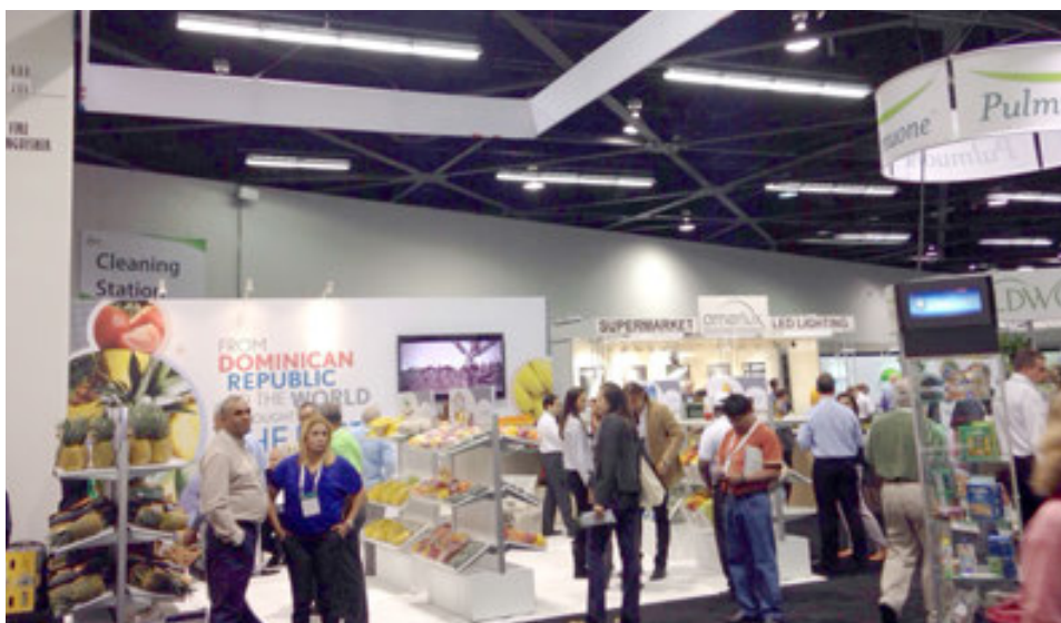
Vista general de la feria "Produce Marketing Association" (PMA) denominada "Fresh Summit", en California, EE. UU.

Durante el año 2014, se realizaron promociones de Agroalimentaria en las siguientes Ferias Internacionales: FIHAV 2014 (Cuba); SIAL 2014 (Francia); Outsourceto LAC 2014 (Guatemala); LAC Flavors 2014 - BID (México); Feria NSA 2014 - (USA); LatinCuisine 2014 (USA); FoodTaipei 2014 (Taiwán); Trade&InvestmentConvention 2014 (Trinidad & Tobago) y Expo Comer 2014 (Panamá).