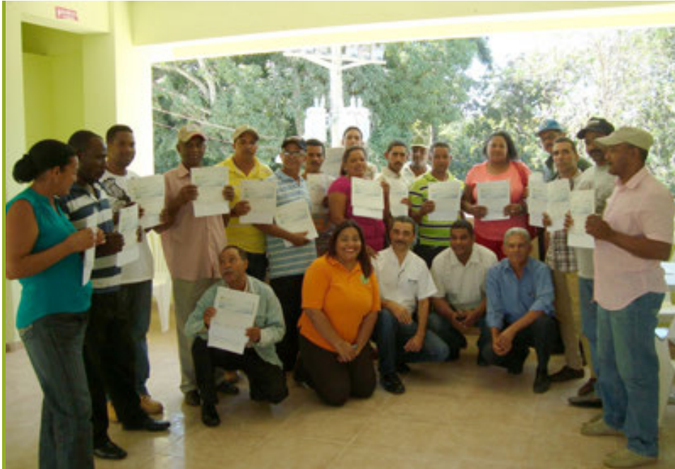
Beneficiados en el programa Financiero de Pymes Agropecuarias

Este proyecto tenía como objetivo fortalecer a FONDAGRO en cuatro componentes: Fortalecimiento Institucional, Fortalecimiento en promoción y captación de recursos, Desarrollar un Plan Estratégico para los próximos tres años y Fortalecimiento a 60 PYMES agropecuarias para la elaboración de planes de negocios e inversión. El monto de este proyecto es por RD$8.0 millones y una duración de 18 meses.