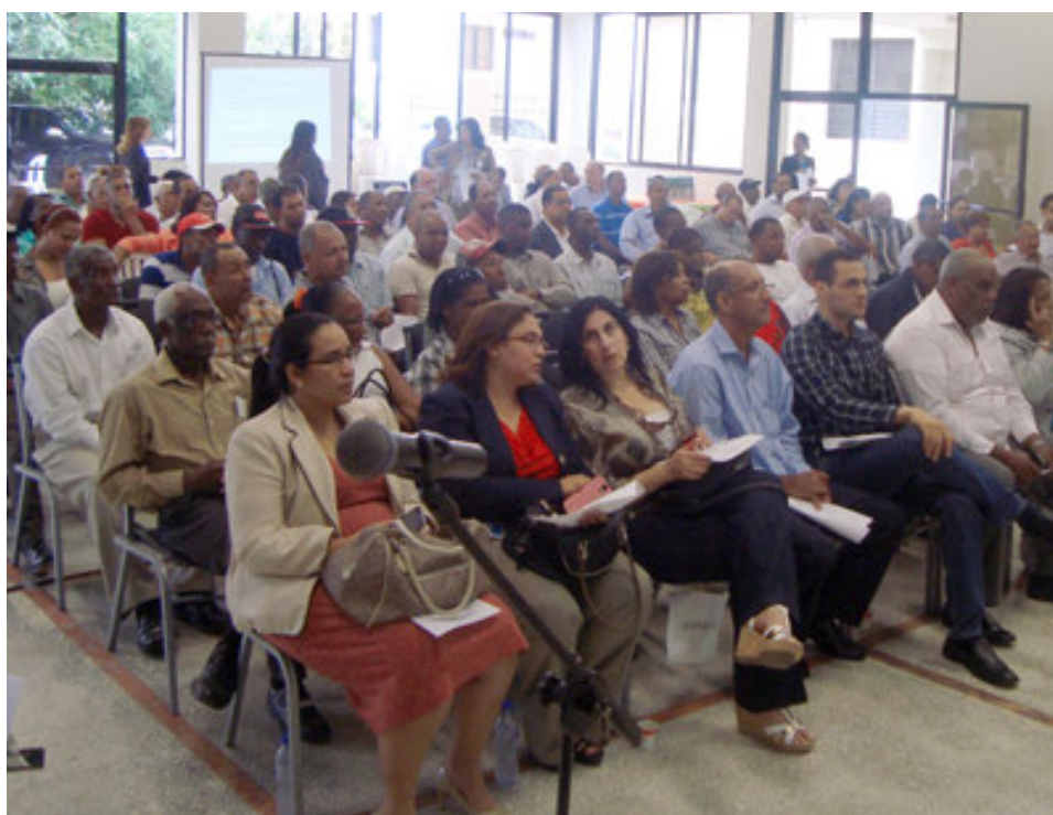
Público presente en la Asamblea general de FONDAGRO en el 2014.

En el encuentro se resaltaron los logros de Fondagro a través de la facilidad de créditos oportunos.