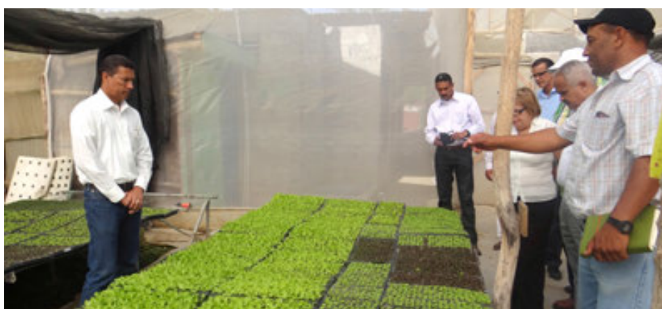
Los técnicos del Grupo Lucas Pérez explican el proceso del Cultivo Hidropónico.