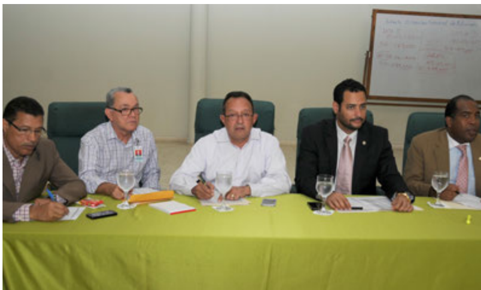
Comisión para la subastas permisos de importación de la BARD.

En 2014 se realizaron un total de 41 Ruedas de Negocios, haciendo transacciones de ofertas y demandas de diversos productos, tales como: Ajíes Morrones, Arroz Selecto A, Arroz Selecto B, Terrenos, Plantas de Aguacate, Huevos, Habichuelas, Azúcar Refina, Azúcar Crema, Finca, Granja, aceite de orégano, coco seco, tomates ensalada y Bungalú, puntillas de arroz, ajo, entre otros, por un monto de RD$5,243,994.00 Pesos.