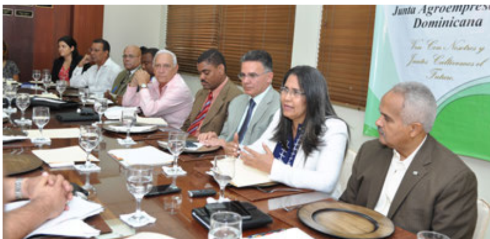
La Ministra de Trabajo, Maritza Hernández, en reunión con los líderes del Sector, sobre el cumplimiento de los deberes y derechos de los trabajadores y empleadores en el sector agropecuario.

Reunión con la Ministra de Trabajo, Lic. Maritza Hernández, para tratar el tema de la Mano de Obra Extranjera en el Campo Dominicano y el cumplimiento del Artículo 135 del Código Laboral que regula la cantidad de mano de obra extranjera que se puede contratar en las empresas dominicanas.