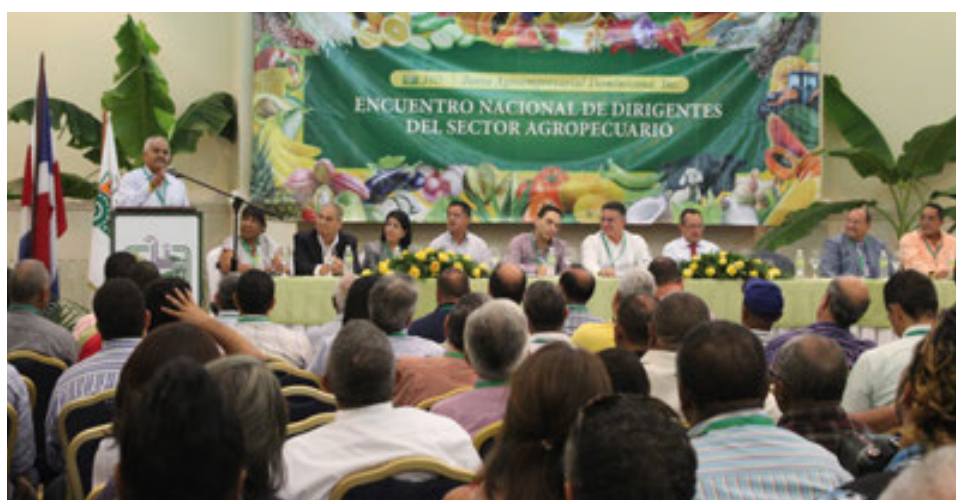
Acto de apertura en el XV Encuentro Nacional de Dirigentes Bayahibe, La Romana.