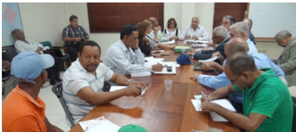
Reunión de Cluster de Invernaderos.

Este tipo de organización está integrado por grupos de productores y agroempresas que generalmente participan de una misma actividad económica o que por sus actividades están relacionadas una con otra.