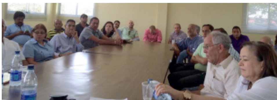
Reunión con Productores en La Vega.

La JAD ha estado trabajando para que los vegetales orientales sigan liderando las exportaciones.