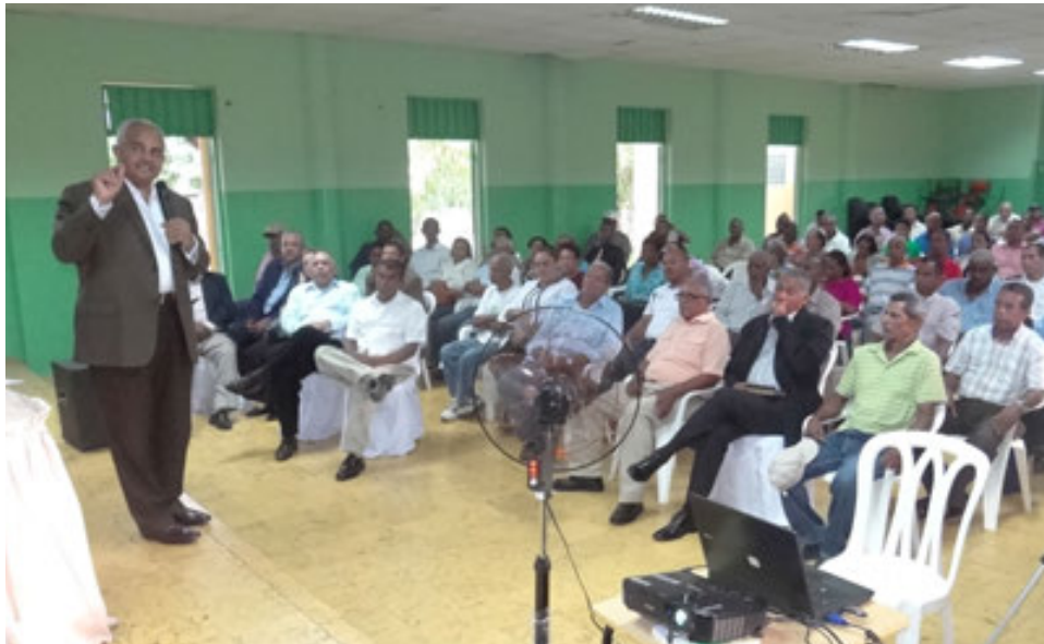
Conferencia a los productores acerca del DR-CAFTA en Yamasá.

Conferencia Monte Plata: Desafíos y Oportunidades ante el DR-CAFTA presentada a la Cooperativa El Progreso, Yamasá, Monte Plata. En la misma se presentó el desarrollo económico y social de la República Dominicana y las oportunidades en la Región.