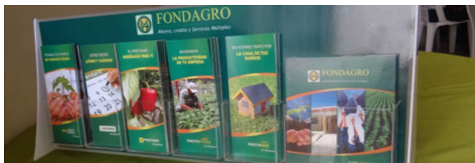
Productos del FONDAGRO.

Esto indica que al 31 de diciembre de 2014, el FONDAGRO, había otorgado 1,412 préstamos colocados a tasas competitivas, con implementación de nuevos productos como son Prestavive, Crédito Puente, entre otros, distribuidos en actividades relacionadas con la agricultura, pecuaria, consumo, construcción, transporte, adquisición de equipos y tecnología.