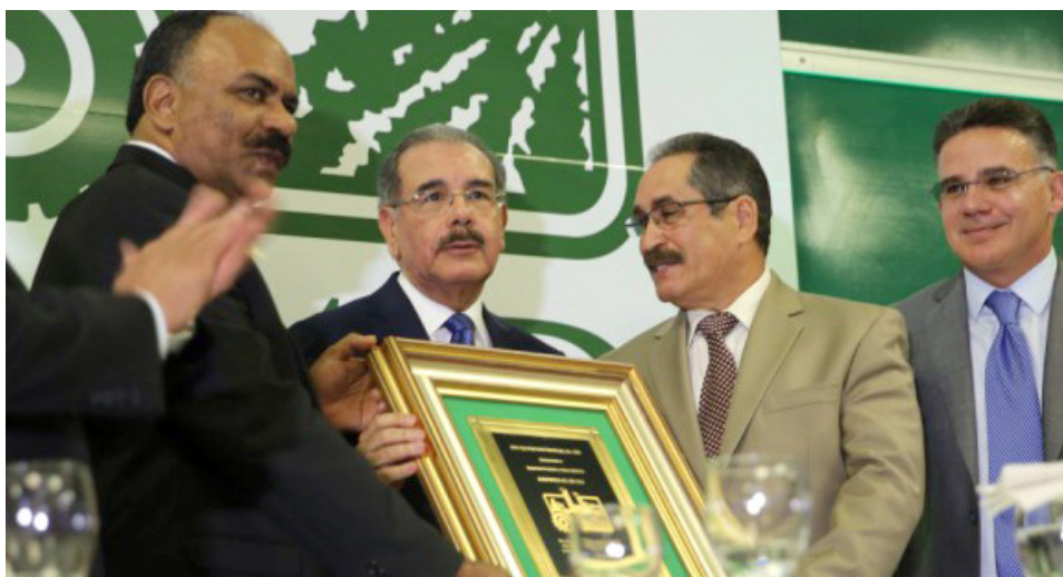
La Junta Agroempresarial Dominicana, Inc. entrega placa de reconocimiento junto al Presidente de la República, Lic. Danilo Medina.