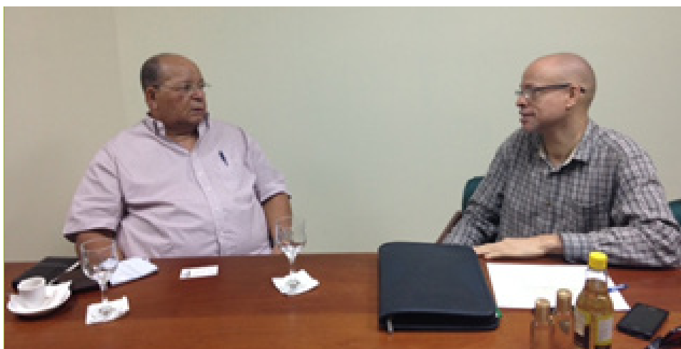
Reunión de negocios con productores de aceite de coco.

A solicitud del comprador, se realizó una visita a la planta de Nikay Bio-Procesos, SRL, ubicada en el Parque Industrial PISAN, de San Cristóbal, donde se pudo observar los procesos de fabricación, almacenaje y las diversas marcas que fabrican.