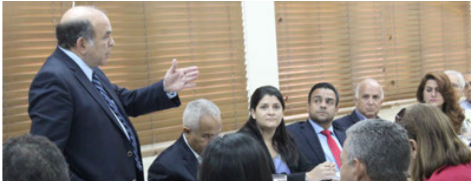
El Ministro de Energía y Minas, Lic. Pelegrín Castillo en reunión con los Líderes del Sector.

Reunión con el señor Pelegrín Castillo, Ministro de Energía y Mina, quien vino a compartir temas de la agenda de interés del sector agropecuario, como es la seguridad energética.