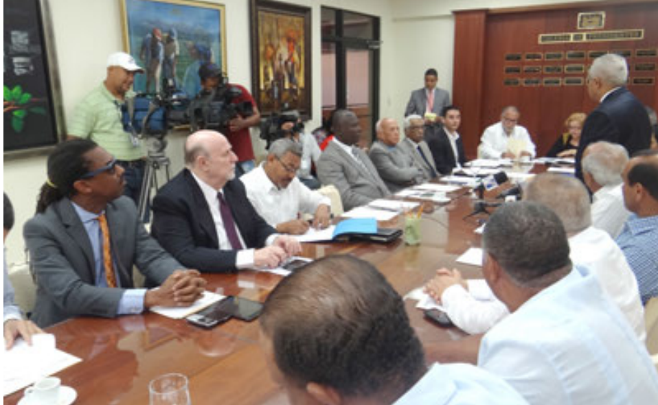
Encuentro Bilateral entre empresarios de la República de Haití y empresarios de la República Dominicana.

La Junta Agroempresarial Dominicana celebró el 2do. Encuentro Bilateral de Agroempresarios de la República Dominicana y de la República de Haití, donde se desarrollaron 4 temas esenciales en la cooperación bilateral: