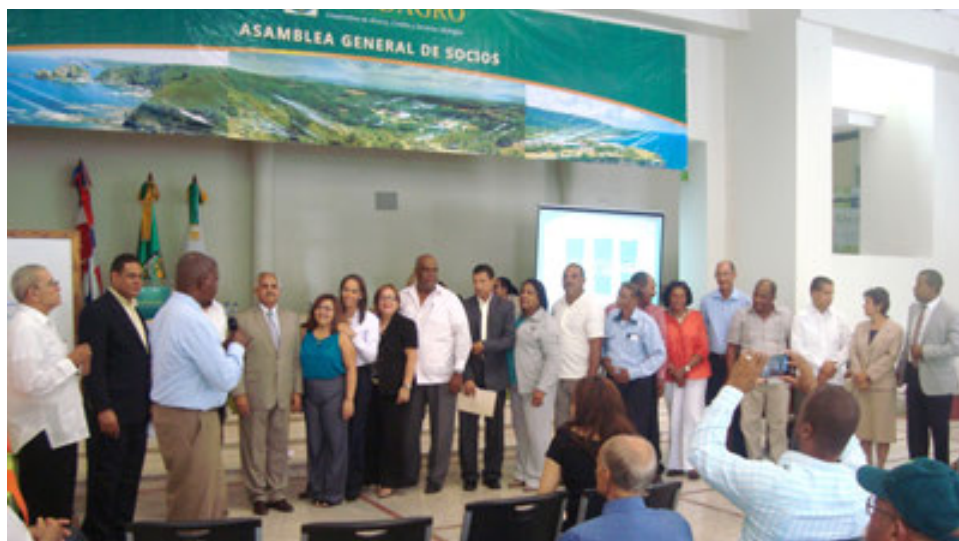
Juramentación de los Consejos elegidos por la asamblea de FONDAGRO.

El Fondo Cooperativo para el Desarrollo Empresarial (FONDAGRO) celebró su octava Asamblea General Ordinaria, en la cual fueron electos nuevos consejos que dirigirán los destinos de esa entidad.