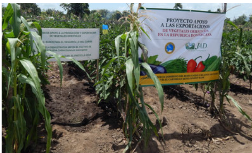
El Caribbean Development Bank apoya a los productores de vegetales del país, a través del acuerdo firmado con la JAD.