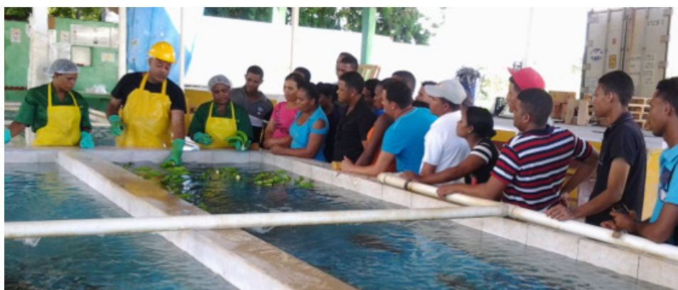
Técnicos explican a los productores parte del proceso de la cadena de frío.

Se ha elaborado un análisis de la situación actual de la Cadena de Frío del banano de exportación, así como un informe de mejoras y un plan de preinversión.