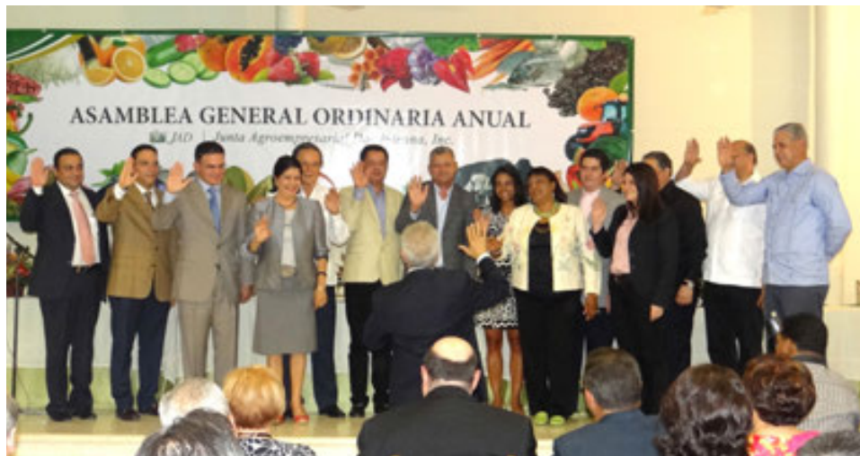
Juramentación Consejo de Directores 2014-2015 en la Asamblea General Ordinaria de la JAD.

Está integrado por un representante de cada subsector tomando las decisiones por consenso. De los 15 miembros integrantes, se conforma automáticamente el Comité Ejecutivo, integrado por el Presidente, Vicepresidente, Secretario, Tesorero y el Presidente Ejecutivo de la JAD.