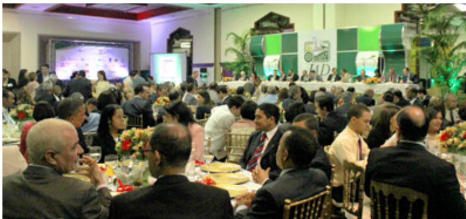
Vista general de la actividad Agroempresario del año 2014 celebrada en el Hotel Hilton.

La Junta Agroempresarial, como parte de su filosofía de trabajo ha instituido el reconocimiento al Agroempresario del Año, como un estímulo y valoración al esfuerzo, dedicación, inversiones, generación de empleos y aplicación de nuevas tecnologías en el sector agropecuario, agroindustrial, medio ambiente y recursos naturales que hacen nuestros socios.