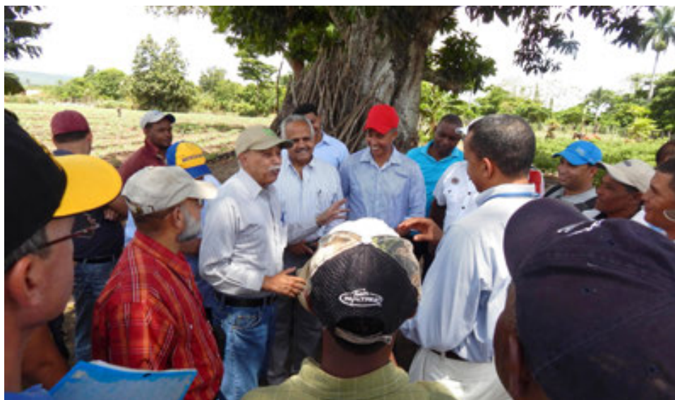
El equipo de Manejo Integrado de Plagas explica a productores sobre buenas prácticas Agrícolas (BPA).

Se dio asistencia técnica a productores de vegetales orientales en las zonas de La Vega, Bonao, Las Matas de Farfán, San Juan de la Maguana y en la región Noroeste, para el manejo integrado del Thrips palmi y el picudo del ají ( Anthonomus eugenii ), así como en el manejo y uso adecuado de plaguicidas en estos cultivos tomando en consideración los requisitos de los mercados financiado por el Banco de Desarrollo del Caribe con fondos del Gobierno del Reino Unido e Irlanda del Norte.