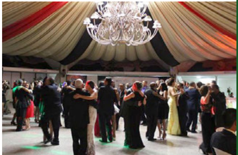
Los invitados disfrutaron de la gran fiesta de la JAD en sus 30 años