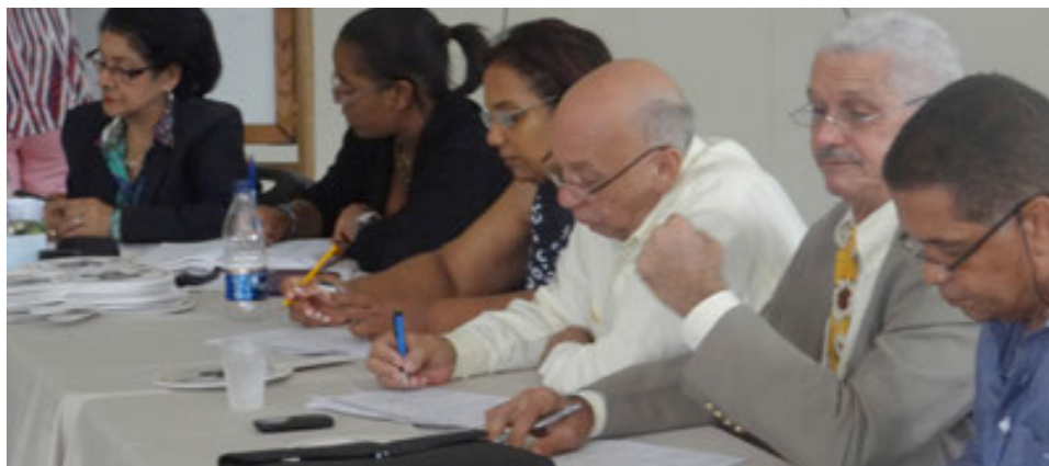
Una de las subastas realizadas en la Junta Agroempresarial Dominicana, Inc.