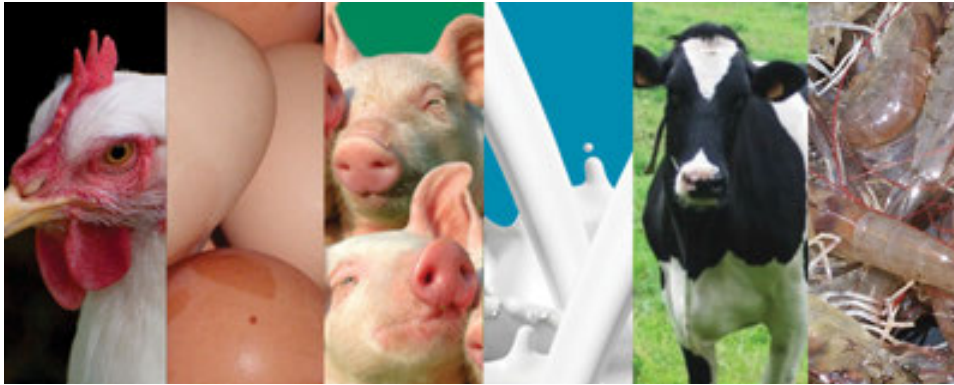
Plantación de tabaco en Santiago de los Caballeros.

El volumen de producción de pollo registró un crecimiento, debido a la planificación entre productores y entidades relacionadas al sector para satisfacer la demanda del mercado local. Además se destaca el apoyo financiero a productores avícolas, reflejado en el aumento de 3.6% en los desembolsos del Banco Agrícola, alcanzando un monto de RD$555.3 millones para este rubro.