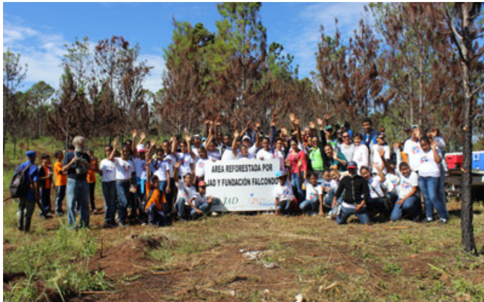
Reforestación con pinos y dos escuelas de la comunidad de La Vega.

Siembra de un viñedo en el Proyecto OcoaBay, Azua.