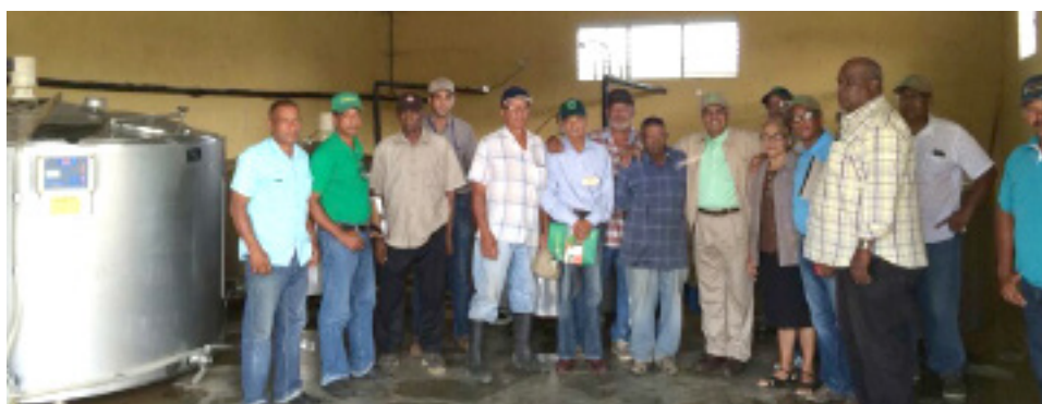
Visita al Centro de Acopio de leche de la Asociación de Ganaderos financiada por Hacienda Los Angeles.

Otra visita fue a El Seibo, la Gina, El Cedro y a la comunidad de El Limón, donde hay 22 mil tareas sembradas de ñame.