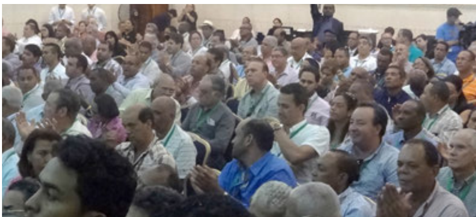
Parte de los Líderes del Sector en el XV Encuentro Nacional de Dirigentes de la JAD.