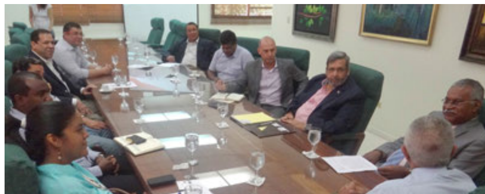
Reunión sobre Energía Renovable.

De igual manera, la organización en Comités, permite fortalecer el liderazgo intermedio, agilizar el ofrecimiento de los servicios y atender a las necesidades de organización de los asociados.