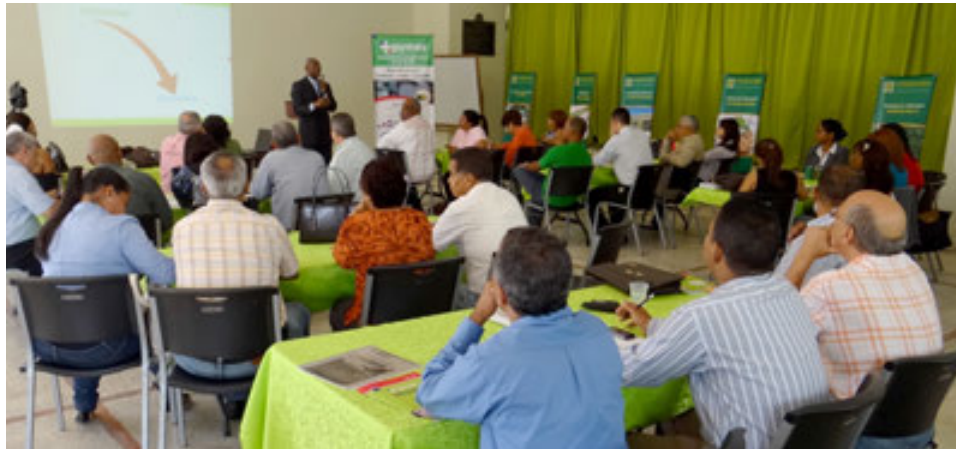
Charla del FONDAGRO acerca de la formalización de una empresa.

Durante el año 2014, FONDAGRO ofreció talleres sobre la Crisis de la Microfinanzas en Nicaragua, Coaching y Liderazgo, Indicadores de Desempeño Financiero, Enfoque de Género en la Microfinanzas, Una Mejor Gestión Gerencial, entre otros.