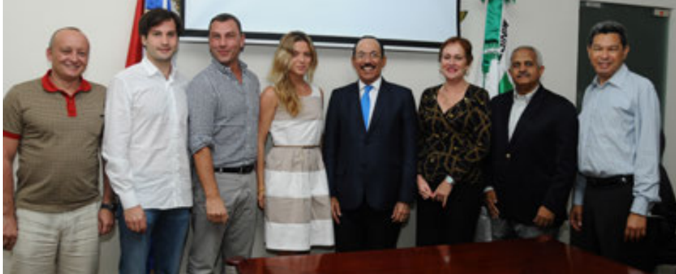
Empresarios rusos de la United Confectionary Manufacturers, les acompañan funcionarios del Ministerio de Agricultura y de la Junta Agroempresarial Dominicana

La JAD participó en una reunión con el principal fabricante de chocolates de Rusia, United Confectionary Manufacturers, quienes están interesados en comprar cacao en grano para la producción de sus chocolates y dulces. Asimismo, informaron sobre el interés de invertir en tierras dominicanas para la producción de este producto y la venta exclusiva para ellos.