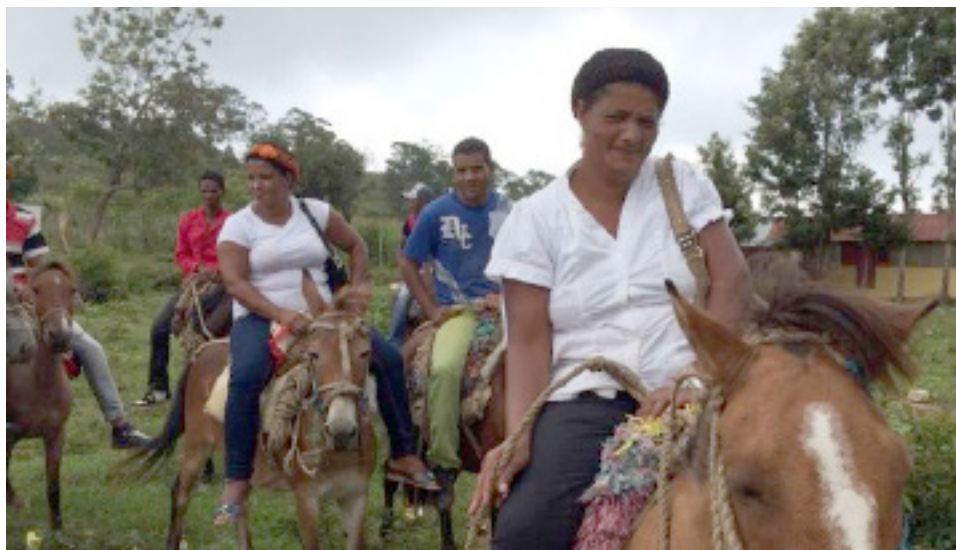
Cruce Constanza-Azua. Terminada reunion de Las Cañitas, las mujeres tomaron sus monturas y llevaron su mensaje de fe.

En el recorrido por la Cordillera de Constanza, cruzando para Azua por Padre Las Casas, donde se realizaron reuniones con todas las comunidades del trayecto. El tema principal en todas las comunidades era: Caminos.