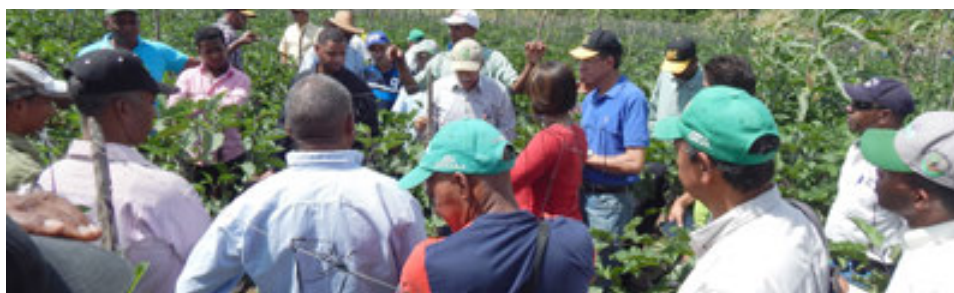
Participantes en el día de campo del Proyecto de Vegetales Orientales en el Pinito, La Vega.

Se elaboró el Plan Nacional Fitosanitario para el cultivo de Banano de la República Dominicana.