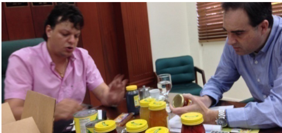
Reunión de Negocios en la JAD con ejecutivos de la Cena Fine Foods.