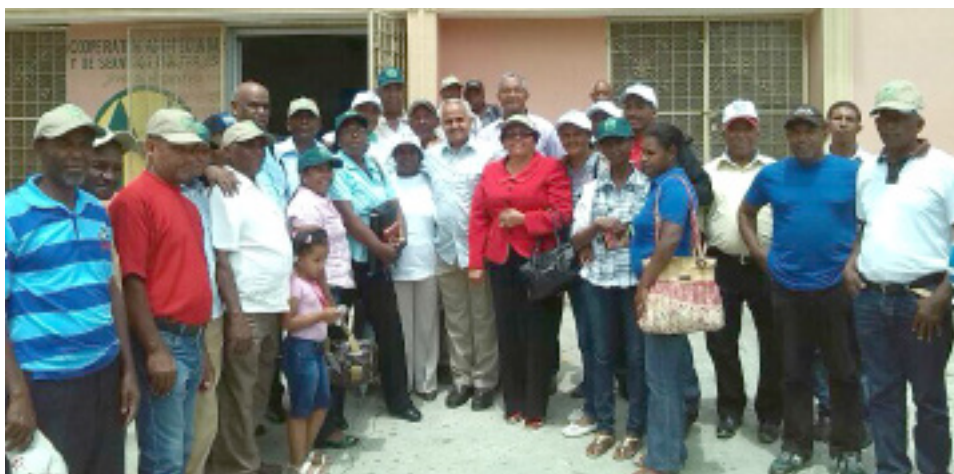
Reunión con los productores de El Cercado, Las Matas de Farfán.

La Junta Agroempresarial Dominicana realizó un intenso calendario de reuniones y visitas a los productores para conocer y escuchar sus necesidades y compartir opiniones acerca del sector agropecuario.