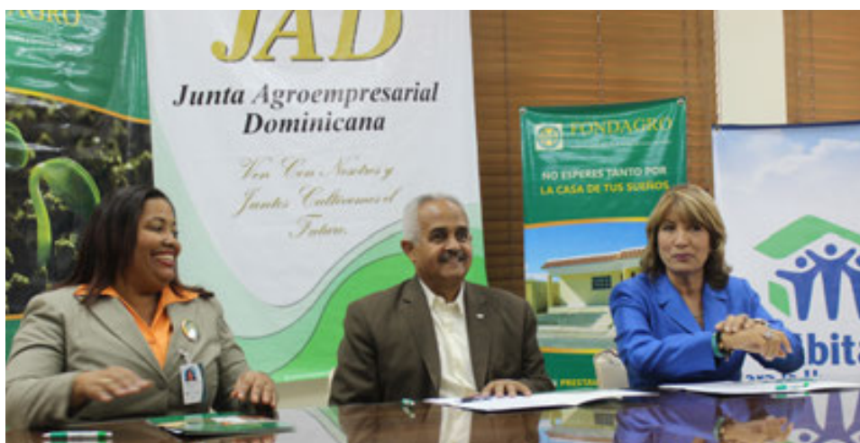
Firma del acuerdo entre FONDAGRO y Habitat para la humanidad.

A nivel nacional ha mantenido relaciones con el Banco de Reservas, Banco BHD-León, las cooperativas de ahorro y crédito el Progreso, San José y Mamoncito en interés de acordar estrategias de negocios y obtener apoyo financiero para el FONDAGRO. Con el interés de buscar apoyo para el financiamiento de la vivienda rural se realizaron reuniones con el BANCO ADOPEM y Habitat para la Humanidad