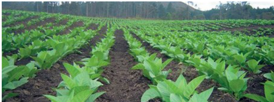
Plantación de tabaco en Santiago de los Caballeros.

La actividad cultivo de tabaco y de productos para preparar bebidas