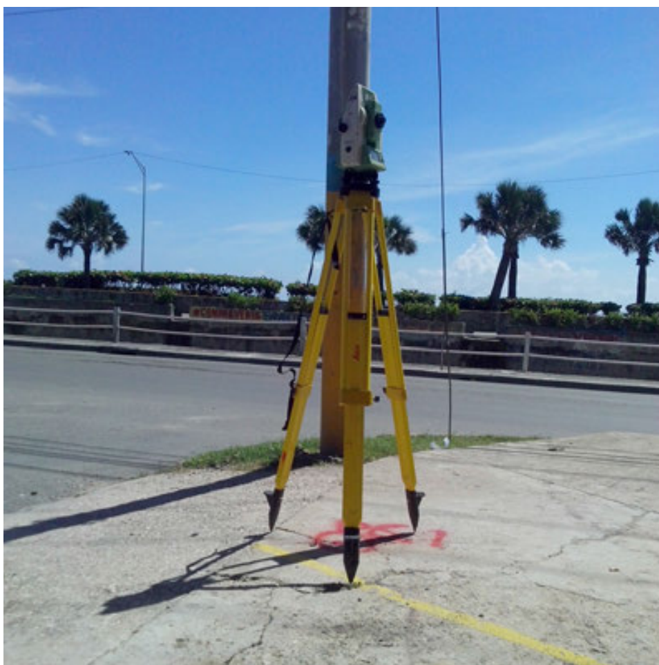
Estación Total Leica.

Se realizaron en Nagua, los levantamientos de Hábitat para la Humanidad, según acuerdo firmado.