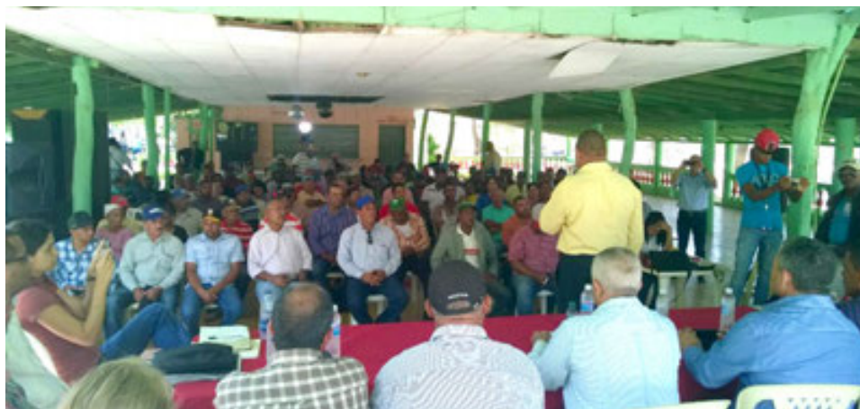
Encuentro en Montecristi, Proyecto BAM.

Elaboración de manuales de operaciones de las instituciones