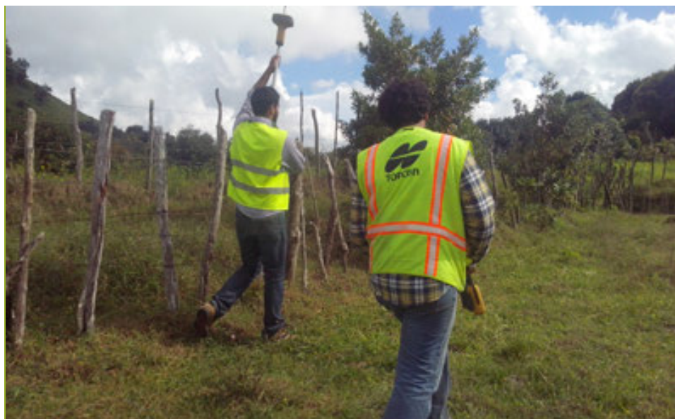
Técnicos trabajando en la Georreferenciación de fincas.

Se trabajó con unos 150 socios dándoles servicios de levantamientos topográficos, planos topográficos y de mensura. Además, se ha trabajado en investigaciones catastrales y asesoría inmobiliaria.