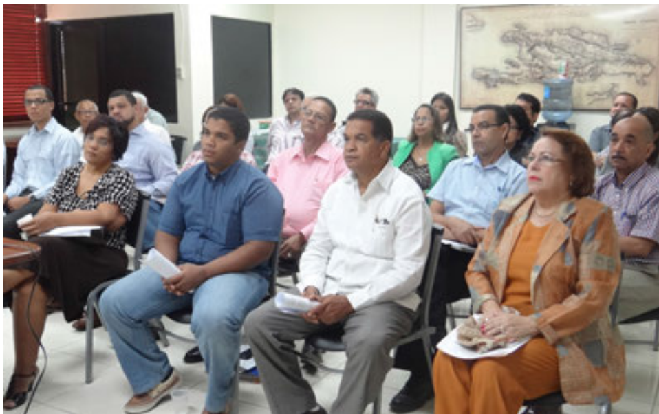
Participantes en el taller impartido por el Comité Nacional Contra Lavado de Activos.