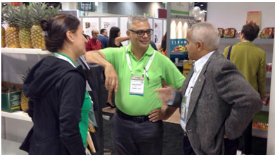
Negociaciones en la feria "Produce Marketing Association" (PMA) denominada "Fresh Summit", en California, EE. UU.

Durante el año 2014, se realizaron promociones de Agroalimentaria en las siguientes Ferias Internacionales: FIHAV 2014 (Cuba); SIAL 2014 (Francia); Outsourceto LAC 2014 (Guatemala); LAC Flavors 2014 - BID (México); Feria NSA 2014 - (USA); LatinCuisine 2014 (USA); FoodTaipei 2014 (Taiwán); Trade&InvestmentConvention 2014 (Trinidad & Tobago) y Expo Comer 2014 (Panamá).