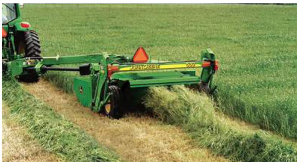
produccion de forrajes de calidad.

Además se sometieron los proyectos Annual Program Statement (APS) Number: APS-517-14-000001. Climate Change Implementation and Adaptation Measures (CLIMA-Adapt) ante USAID; Respuesta de becerros alimentados con harina de hojas de especies arbustivas ensiladas; Diseño, desarrollo e implantación de un nuevo método de producción orientado a mejorar los procesos productivos del sector agropecuario en República Dominicana, y Diseño, desarrollo e implementación de un sistema automatizado de producción de cereales en República Dominicana ante la MESCYT.