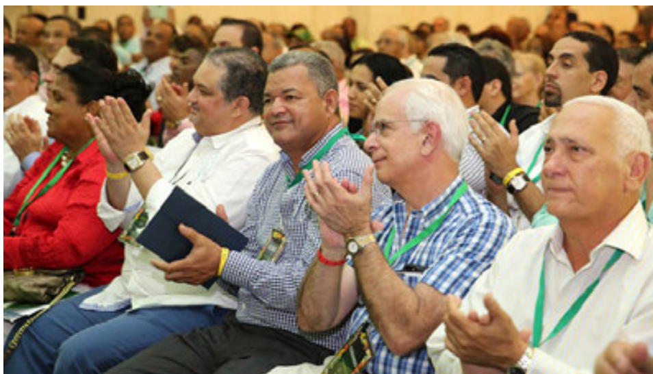
Participantes en el XV Encuentro Nacional de Dirigentes, en Bayahibe, La Romana.

Esta actividad contó con la participación de más de 450 dirigentes del sector agropecuario, una representación de todas las Provincias, y altos funcionarios de instituciones estatales.