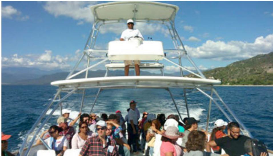
Ruta del Viñedo y paseo en bote en Ocoa Bay.