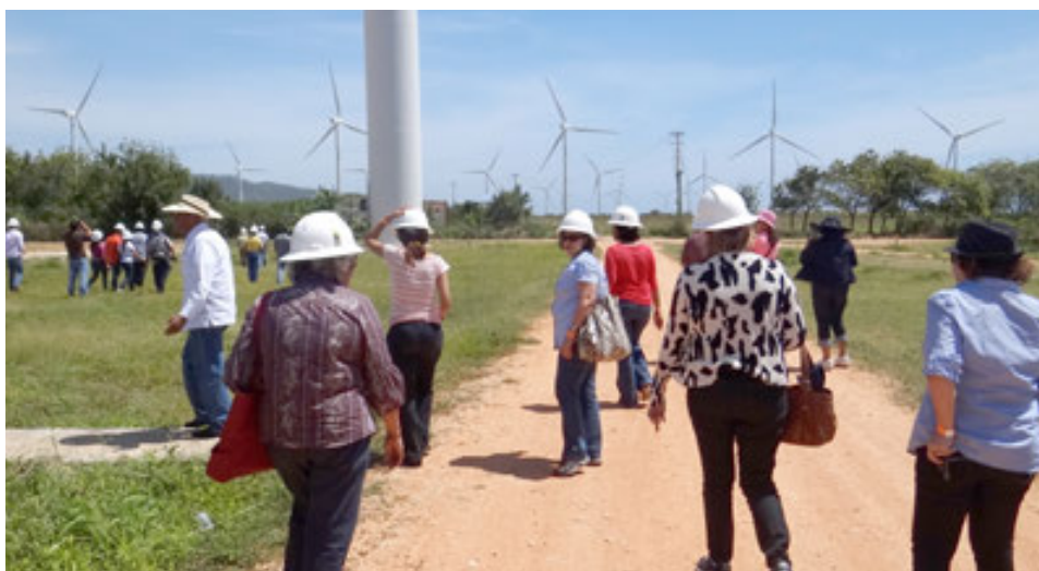
Ruta Agroturística al Parque Eólico Los Cocos.

La JAD realizó una ruta a Jarabacoa donde incluyó la participación en la actividad “Fiesta con la Naturaleza”, iniciativa de la Escuela Ambiental de Jarabacoa, para celebrar el Día Mundial del Medio Ambiente, promoviendo una cultura de conservación.