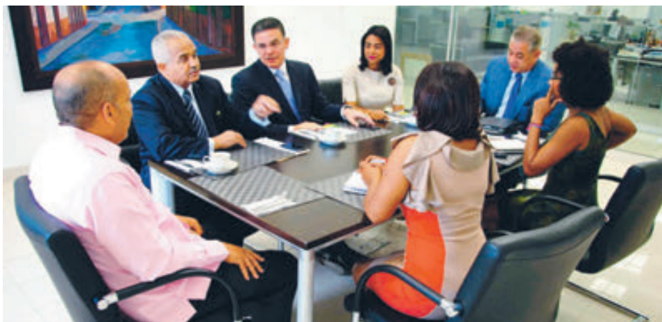
Directivos de la JAD en el desayuno del periódico HOY.

El Comité Ejecutivo de la JAD participó en el Desayuno Económico del Periódico Hoy donde se propuso la creación de una mesa agrícola que defina una estrategia para la producción agropecuaria y le dé seguimiento periódico a su ejecución, a fin de que el país pueda cerrar la brecha entre los bienes agrícolas importados y los que exporta.