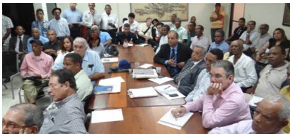
Reunión de Conjuntos Productivos de la JAD sobre Vetiver.

La JAD desde sus inicios, ha organizado a los productores en Comités Sectoriales de Trabajo, Conjuntos Productivos o Clusters, con el objetivo de facilitar el apoyo y canalización de los diferentes servicios requeridos por cada uno de ellos.