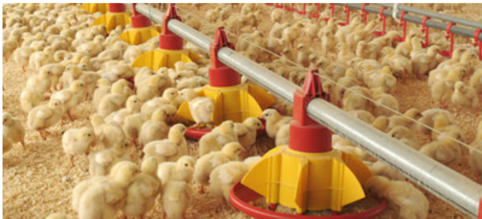
Equipos y partes utilizadas en naves Avícolas.

Nuestra institución realizó unas 612 gestiones administrativas y gubernamentales, la mayoría ante la Dirección General de Aduanas (DGA) y la Dirección General de Impuestos Internos, procurando un trato justo en la aplicación de impuestos a las importaciones de insumos, equipos, maquinarias y materiales utilizados en la producción agropecuaria.