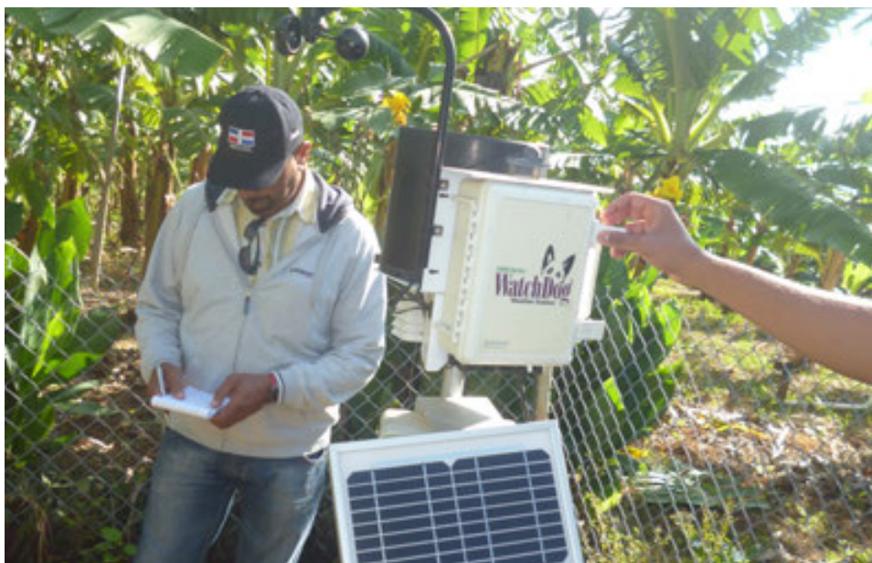
Instalación de Estaciones Meteorológicas, en el cultivo de banano.

Ubicación zonas piloto de Preaviso Biológico, elaboración guía para la preparación de mezclas y uso moderado de fungicidas en las aplicaciones en el cultivo del banano.