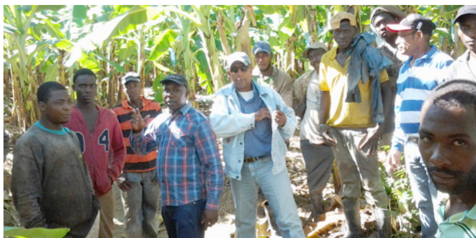
Asistencia Técnica a productores de banano.

Se trabajó con un Fondo de Financiamiento y con las políticas de mecanismos de crédito y cobranza.