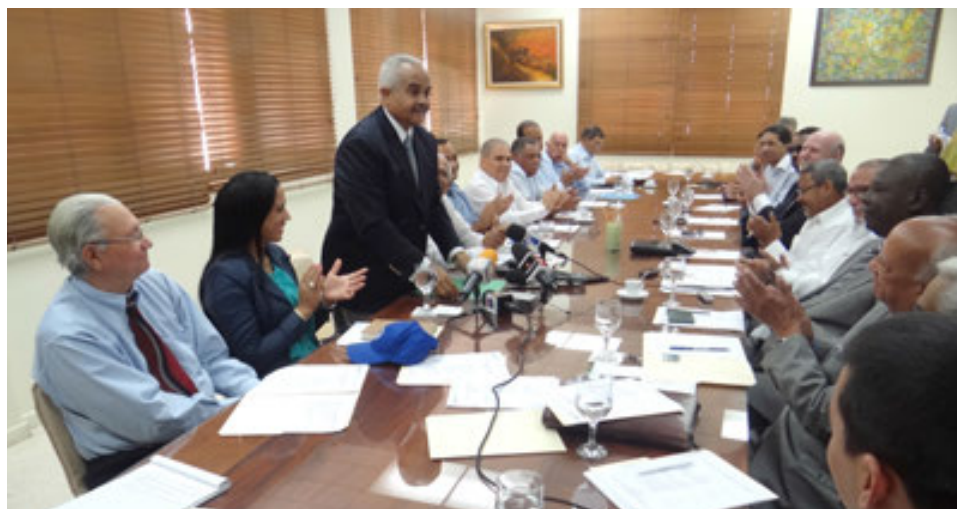
Parte de los asistentes en el Encuentro Bilateral entre empresarios de la República de Haití y empresarios de la República Dominicana.