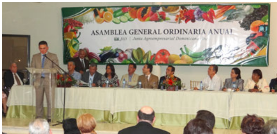
Mesa directiva en la Asamblea General de la JAD, 2014.

En la Asamblea se conoce las Memorias y Estados Financieros presentados por el Consejo de Directores, para fines de información y descargo.