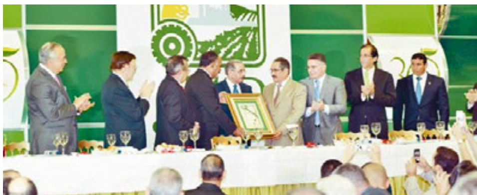
Participantes en la ruta Agroempresarial de las Alcaparras en Montecristi.

Esta actividad contó con el patrocinio de las empresas: RICA, Agrotécnica Central, Agrocomercial Import, Banco Popular, Banco Santa Cruz, CAEI, Cartones del Caribe, Central Romana Corporation, Cobb Caribe/ UNIPOLLO, FERQUIDO, FERSAN, Grupo Banamiel, INDUBAN, Instituciones Pecuarias Dominicanas, JUCALIN, LINDA, Philip Morris, SANUT, SAVID, YOPLAIT, Jardín Constanza, JOHN DEERE y Tropijugos.