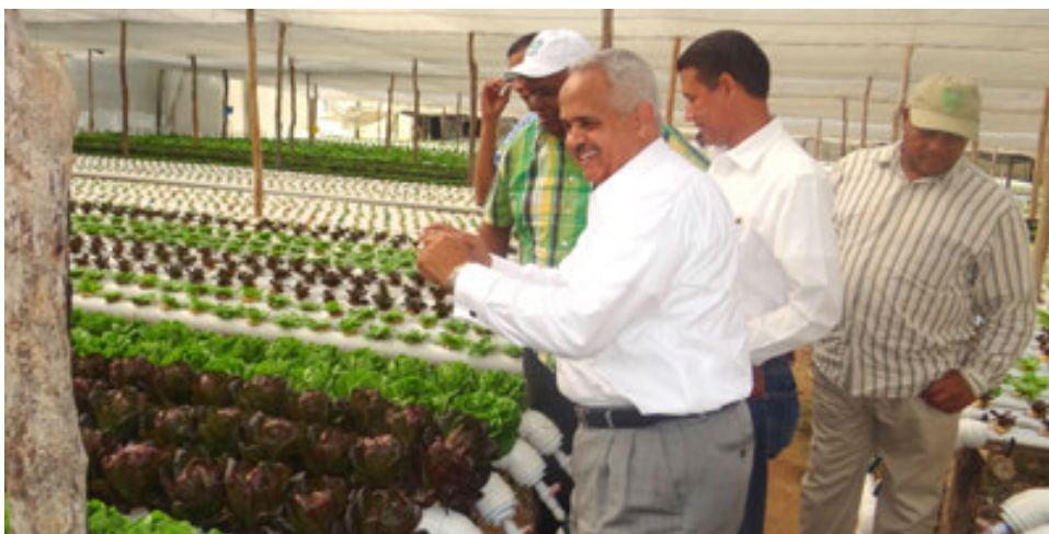
Cultivo Hidropónico de lechuga en la finca del Grupo Lucas Pérez.

Se realizó una visita al Proyecto del Grupo Lucas Pérez, donde tienen un gran cultivo hidropónico de lechugas moradas y verdes. En el recorrido de las instalaciones se pudo constatar la efectividad de este método en los cultivos y lo innovador de la técnica que representa un paso de avance en diversos temas vitales para la agricultura, como los altos niveles de inocuidad.