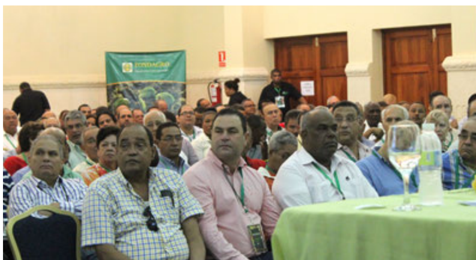
Líderes del Sector.