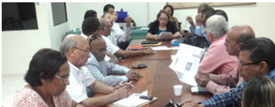
Rueda de Negocios de la BARD.

La Bolsa Agroempresarial de la República Dominicana. La BARD es una empresa afiliada a la Junta Agroempresarial Dominicana, Inc. (JAD). Constituida bajo las regulaciones de la Ley del Mercado de Valores No.19-00 y su Reglamento de Aplicación 729-04. Inició sus operaciones en junio de 1997, y puesta en operación mediante decreto No. 386-97 del Poder Ejecutivo. En el año 2014, la Bolsa Agroempresarial de la República Dominicana, S. A. (BARD) fue convertida en una Sociedad Anónima, de acuerdo a la nueva Ley de Sociedades.