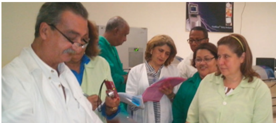
Visita al Centro de Ensayo para el Control de la Calidad de los Alimentos (CENLAD) en Cuba para Capacitación Norma ISO-IEC-17025

técnicos de la República Dominicana en el diagnóstico y caracterización de esta enfermedad, conocida como el Mal de Panamá, la cual es cuarentenaria para el Caribe y América.